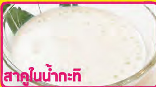
สาหร่ายในน้ำกะทิ

あったかココナッツゼリー 税込価格 ¥530 「カノム トゥアイ」 P-4 KANOM TUAY (Thai Coconut Rice Custard)