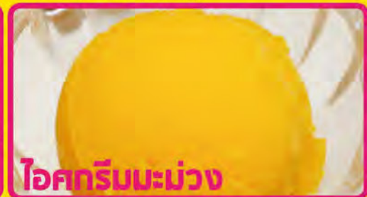
ไอศกรีมมะม่วง

P-1 ICECREAM GATI (Coconut Icecream with Clashed Peanuts)