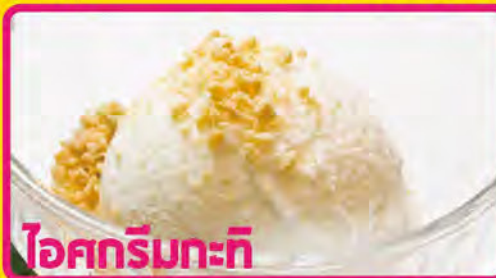
ไอศกรีมกะทิ

P-6 SAKU NAM GATI (Tapioca with Coconut Milk)