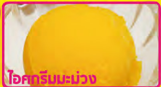
ไอศกรีมมะม่วง

ココナッツアイスクリーム 税込価格 ¥340 ピーナッツかけ P-1 ICECREAM GATI (Coconut Icecream with Clashed Peanuts)