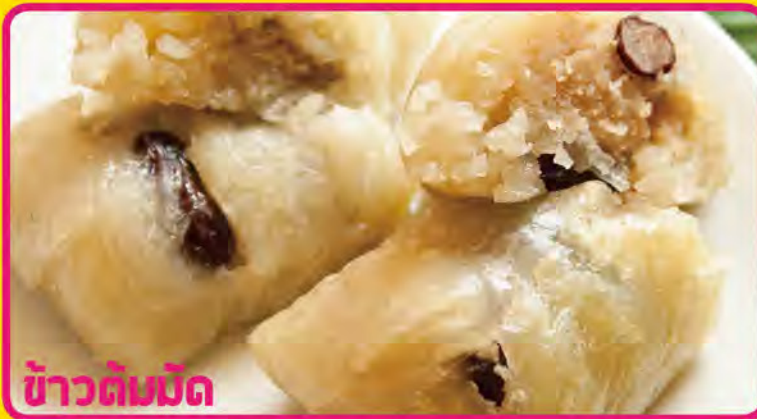
ข้าวต้มมัด