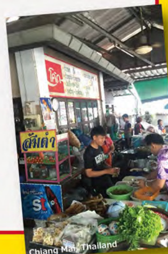
Chiang Mai, Thailand

カオ・ソーイ 税込価格 ¥1,100 J-70 KHAO SOI (Chiang Mai Style Curry Noodles)