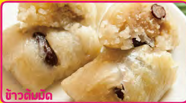
ข้าวต้มมัด

タイ式ちまき (バナナ&タロイモ) 税込価格 ¥600 「カオ トム マット」 P-8 KHAO TOM MAD (Banana & Taro in Sticky Rice)