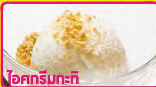
ไอศกรีมกะทิ

タピオカミルク 税込価格 ¥340 「サークー」 P-6 SAKU NAM GATI (Tapioca with Coconut Milk)