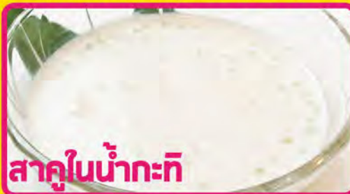
สาหร่ายในน้ำกะทิ

P-4 KANOM TUAY (Thai Coconut Rice Custard)