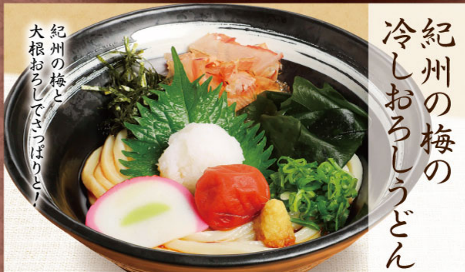
紀州の梅の 冷しおろしうどん