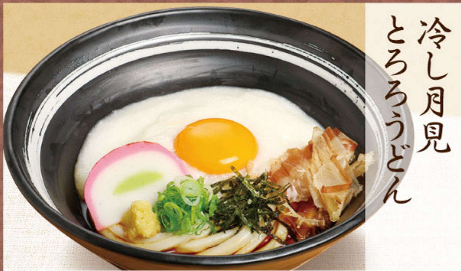
冷し月見 とろろうどん