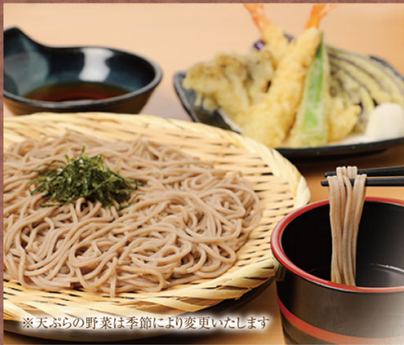
季節の天ざるそば