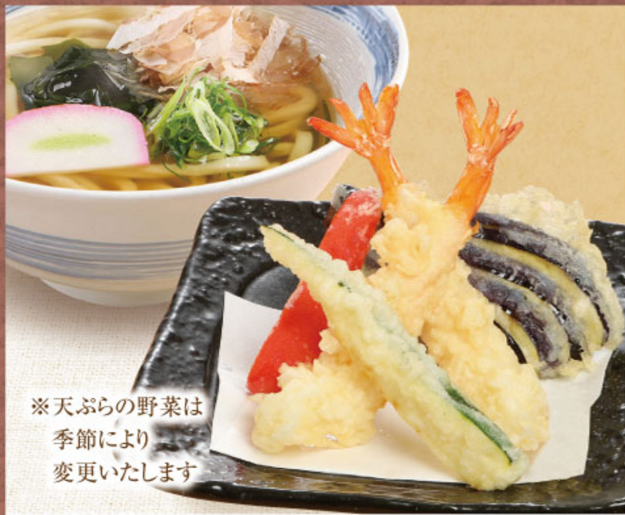
季節の 天ぷらうどん(上)