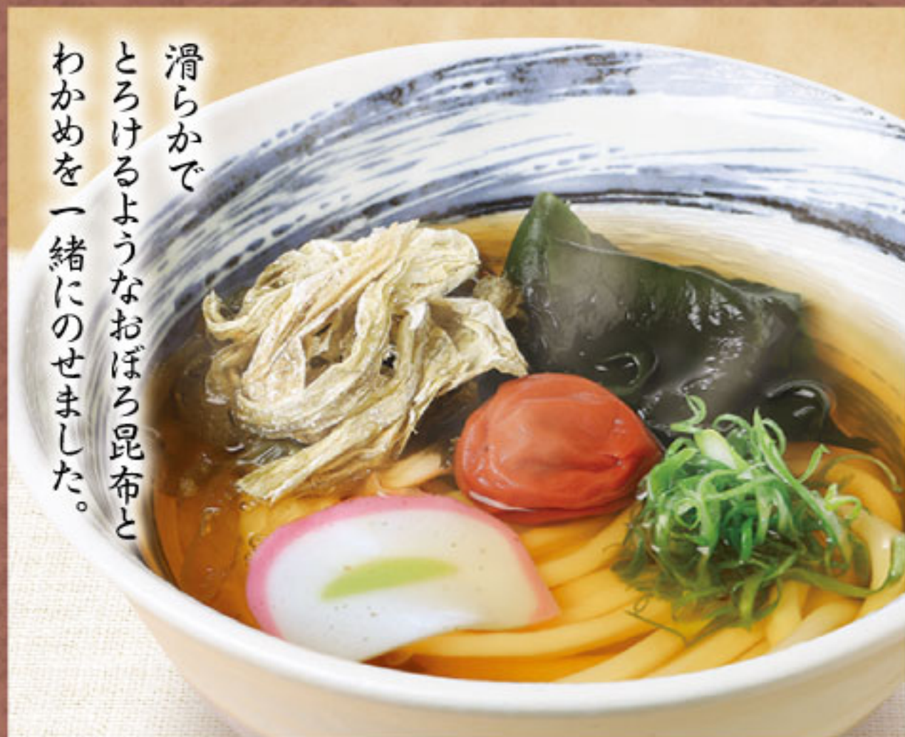
紀州の梅とわかめの 昆布うどん