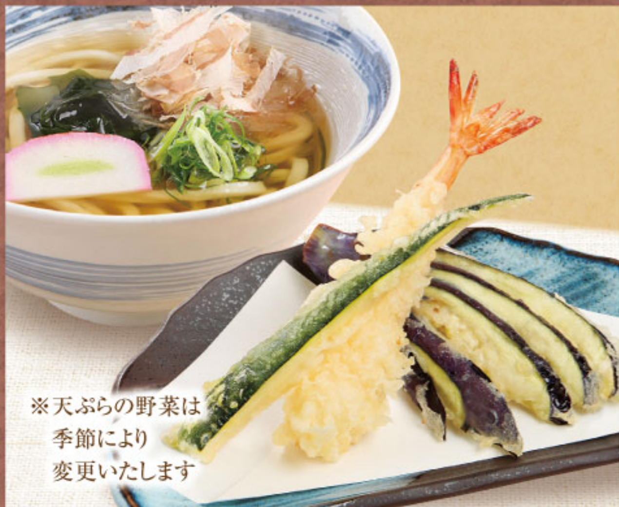
季節の 天ぷらうどん(並)