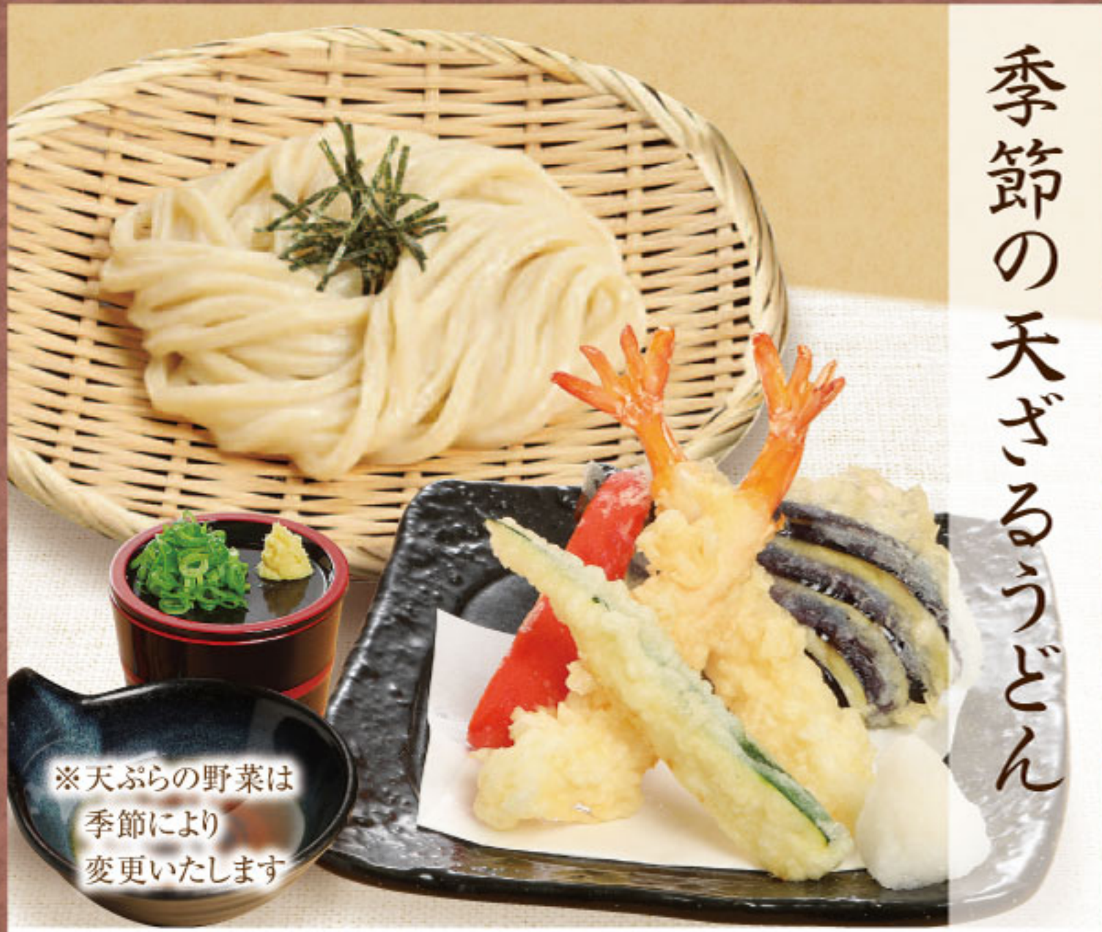
季節の天ざるうどん