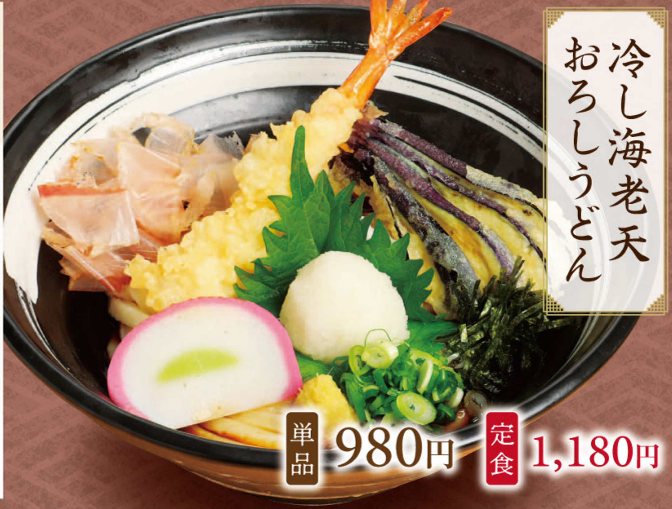
冷し海老天 おろしうどん