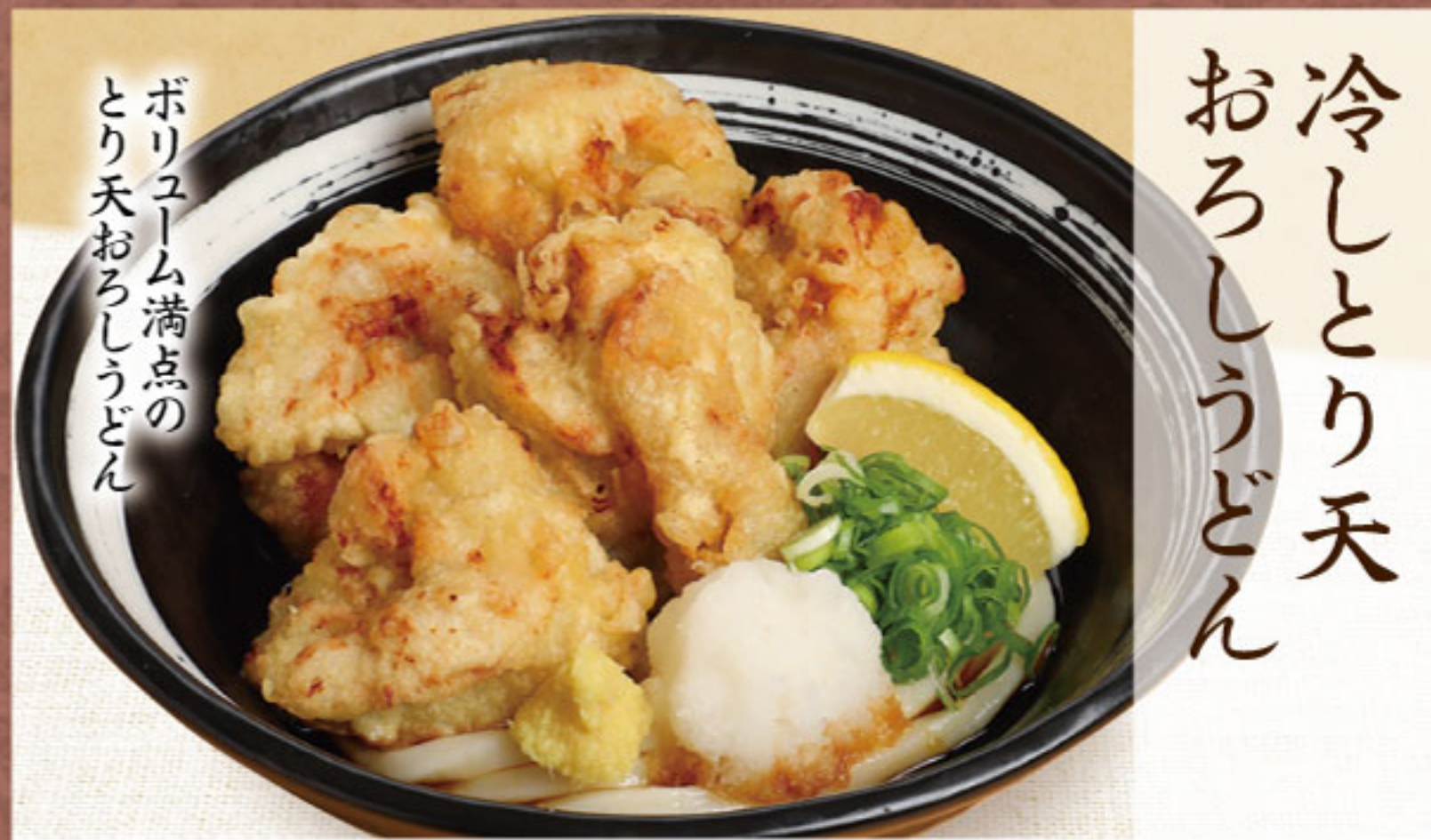
冷しとり天 おろしうどん