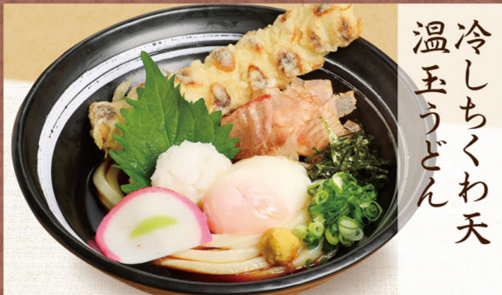
冷しちくわ天 温玉うどん