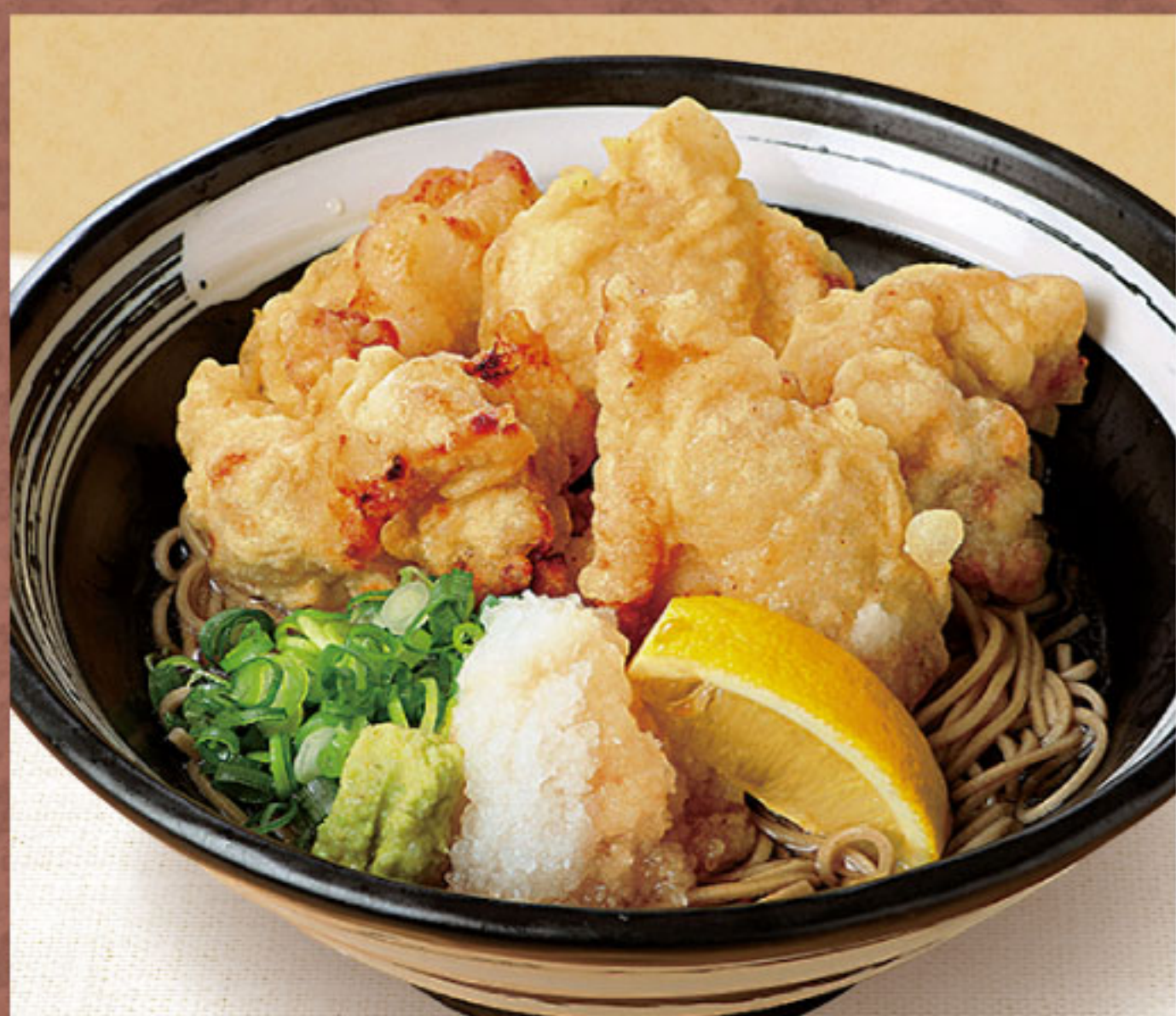
冷しとり天おろしそば